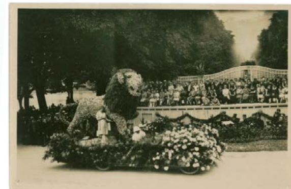
Le Lion de 1925