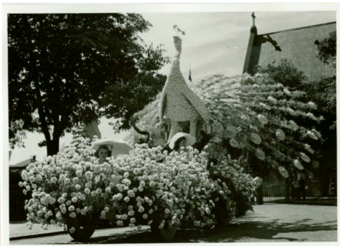
1 er prix en 1923